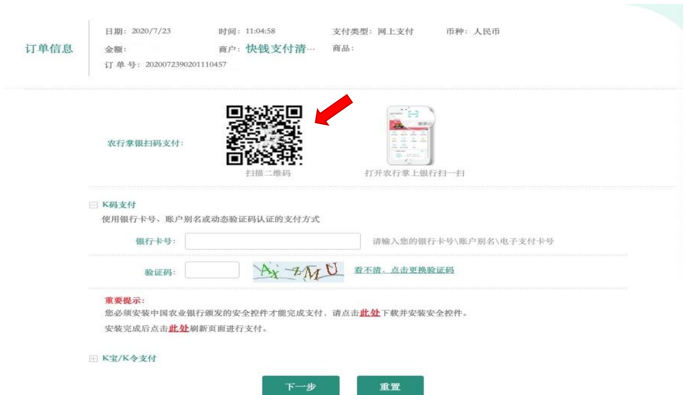
图5（农业银行支付界面）